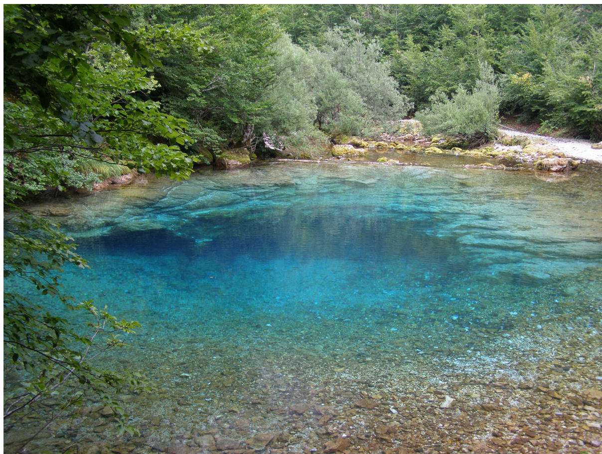
Fot. 1 Panorama wywierzyska

Jaskinia Savino oko (Oko Skakavica) położona jest na granicy Czarnogóry i Albanii w Górach Prokletie (Przekłete), niedaleko miejscowości Vusanije w dolinie Ropojana. Wywierzysko jest znanym lokalnym miejscem turystycznym. Pierwsze informacje o tym nim zostały dostarczone przez polskie ekipy grotolazów prowadzących eksplorację w suchych jaskiniach w regionie Gór Prokletie. Pierwsze znane nurkowania zostały przeprowadzone przez członków międzynarodowej ekipy (SW Warszawa, SOB Belgrad), wówczas jaskinia została wyeksplorowana do głębokości 65m ( http://gnj.org.pl/ ). Podczas tego wyjazdu działania pozwoliły zanurkować na głębokość 90m i wydłużyć ją o 50m.