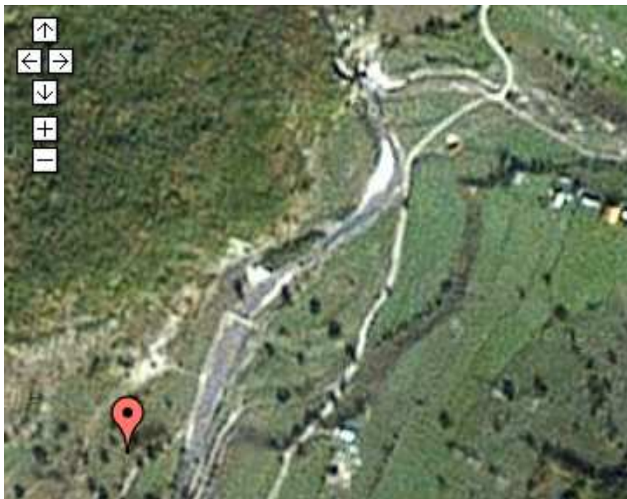
Ryc.1 Plan umiejscowienia wywierzyska (Google).

Nurkowania w tej jaskini należą do trudnych z powodu dużego prądu, niskiego profilu korytarzy oraz temperatury wody. Dalsze nurkowania przewidziane są późną wiosną 2009 w międzynarodowym składzie oraz planowane jest zastosowanie podwodnego habitatu.