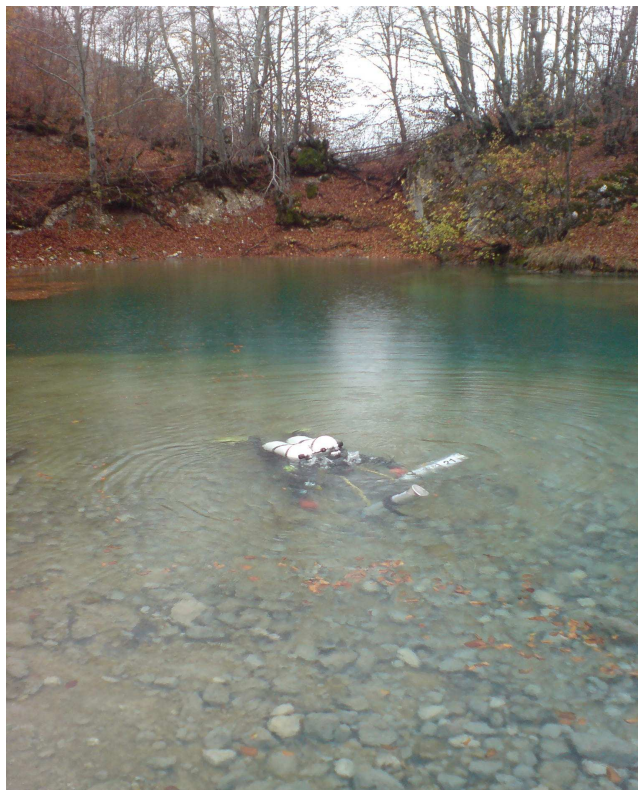
Fot. 2 Przygotowanie do nurkowania